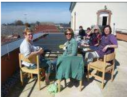
Nach dem Sehtraining entspannen wir auf unserer Terrasse