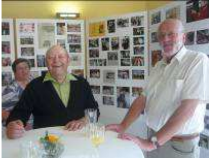
Gute Stimmung bei der Feier „25 Jahre Haus op der Heed“